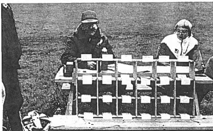
Lasse/-OY med tomma fack för lagens rävsaxar.