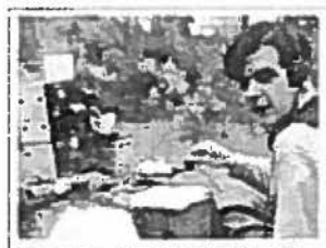
Stationen "Berit" uttagen ur resväskan för att hanteras enklare under jakten

Efter femtio år som sändaramatör kan man se tillbaka på en eller annan händelse som framstår lite klarare än det vanliga trastuggandet på banden. En sådan är följande äventyr från försommaren 1954.