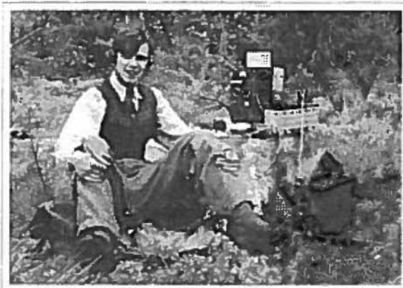
Se "mackan" på stubben. Jag behövde inte svälta i alla fall!